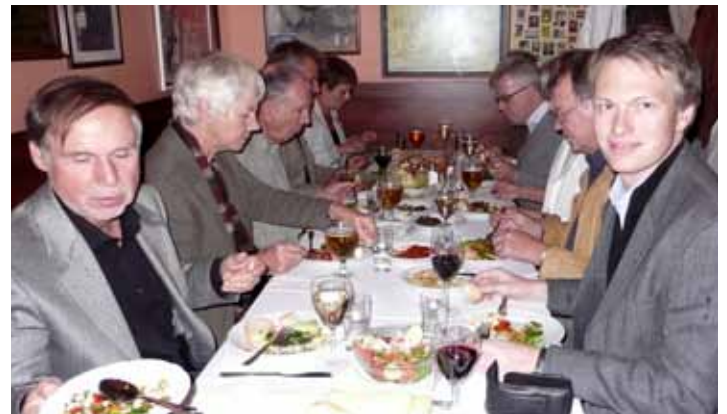
unterwegs in Istanbul